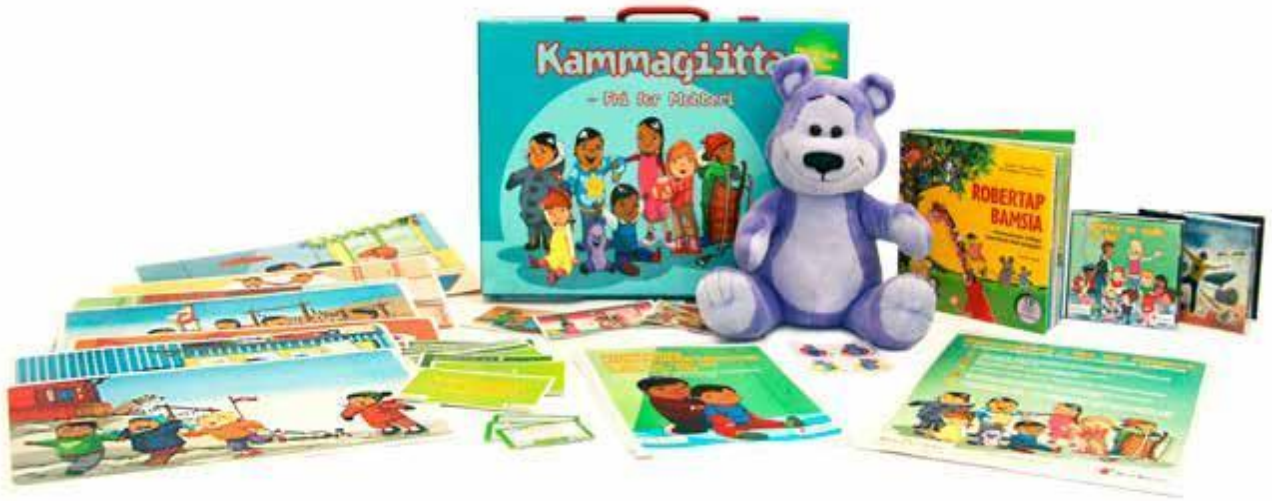
Kammagiittami kufferti imaalu

pissutsinut, tamatumunngalu ilanngullugu meeqqat akunnerminni atugarissaarnerannut, sunneeqataasarnerat.