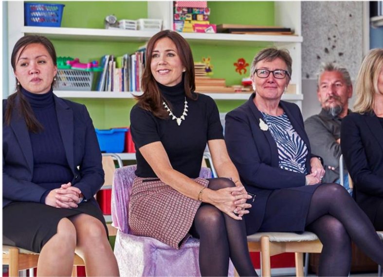
Kronprinsessi Kammagiittap 2016-imi aallartisarneqarneranut atatillugu Kalaallit Nunaannut tikeraarteq