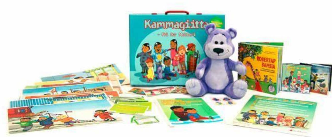
Kammagiitta-kuffert og indhold

Det betyder fx, at der også ligger op til at beskæftige sig med, hvordan personalegruppen omtaler og agerer pædagogisk og muligvis ikke-pædagogisk overfor børnene. Baggrunden er, at personalepraksis udgør en (med)betingelse for kulturen i institutionen og skoleklassen og herunder også børns indbyrdes sociale trivsel.