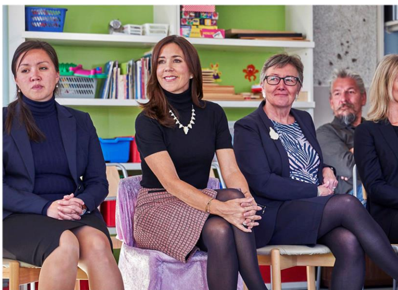
Kronprinsessens besøg i Grønland i forbindelse med implementeringsarbejde af Kammagiitta 2016

Projektets bærende produkt er en "kuffert" til personalet med faghæfter samt diverse artefakter, der kan bruges til dialoger og aktiviteter med børnene såsom samtaleplancher, bamse til at komme på skift med hjem hos børnene, rytmikmateriale og små bøger. Der er også dilemmakort, der kan anvendes til forældremøder samt til personaledrøftelser, for at starte dialoger om forskellige perspektiver, der kan føre til vanskeligheder og passivitet i situationer om mobning. Derfor betegnelsen "dilemma". Kufferten bestilles (eller lånes) som en pakke, hvor der som udgangspunkt også indgår et introduktionskursus, dette for at sikre, at materialet anvendes som tiltænkt af frontpersonalet. Der er udviklet to grundkufferter til Kammagiitta, én udgave til institutioner og dagpasninger og én udgave til yngstetrinnet i folkeskolerne.